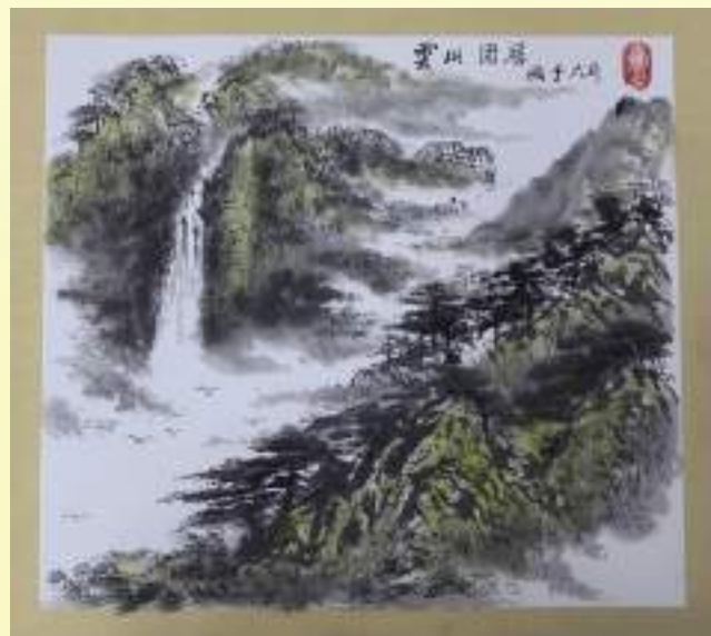
孔宪玉《云山固居》绘画类第三名